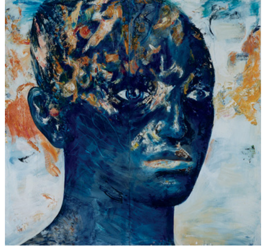
Claes Eklundh, "Ansikte!", olja på duk, 160x150 cm