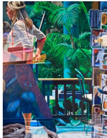
"Passage", olja på duk, 140x105 cm

Född 1952 i Helsingborg Bor och arbetar i Lund