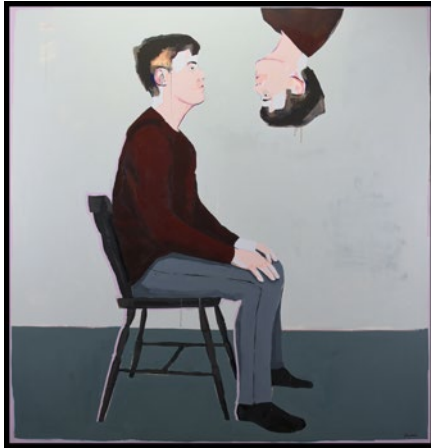
"Där då", akryl och spray på duk, 170x160 cm

Född 1992 i Linköping Bor och arbetar i Linköping