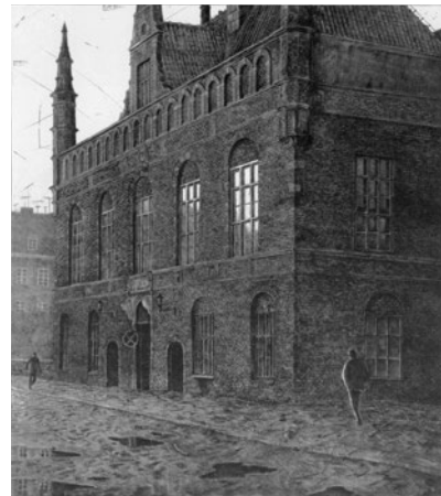
"Crossroads", tornnålsgravyr, 79x69 cm

Född 1953 i Uppsala Bor och arbetar i Stockholm