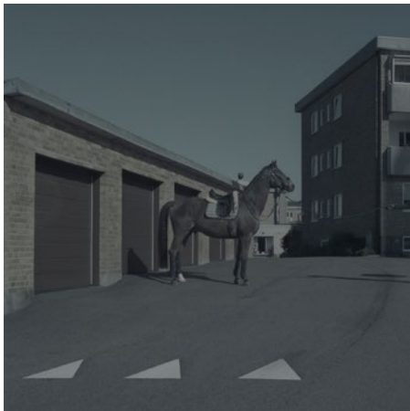
"SWEDISH BLUE I", analogt fotografi, Archival pigment print, 13x13 cm

Född 1972 i Landskrona Bor och arbetar i Landskrona