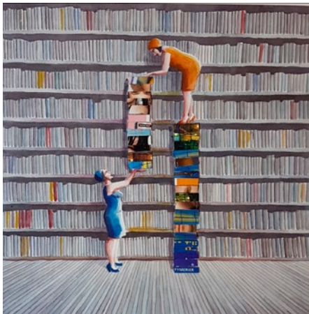
"The power of teamwork", mixed media 45x45 cm

Född 1960 i Moskva Bor och arbetar i Stockholm