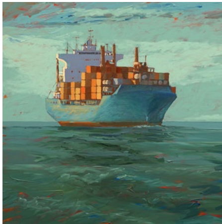
"Civilisation 3", akryl på duk, 88x100 cm

Född 1951 i Ronneby, Bor och arbetar i Nässjö