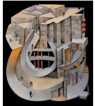
"Husbåt", akryl på mdf, 50x40 cm

Född 1957 i Malmö Bor och arbetar i Halmstad