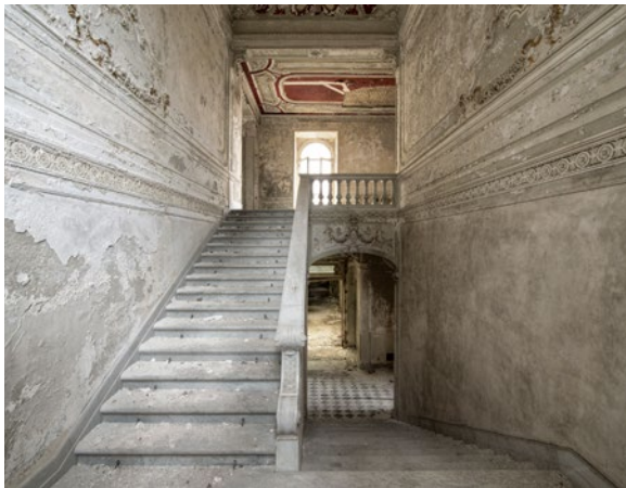
© Foto Daan Oude Elferink, "Stairs of Memories", digital print, aluminium och resin

Född 1978 i Nijmegen, Holland Bor och arbetar i Amsterdam