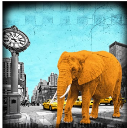
"Getting late", mixed media

Född 1962 i Lysekil Bor och arbetar i Göteborg