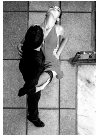
El ultimo tango, Fine art print

Bor och arbetar i Norfolk, östra England