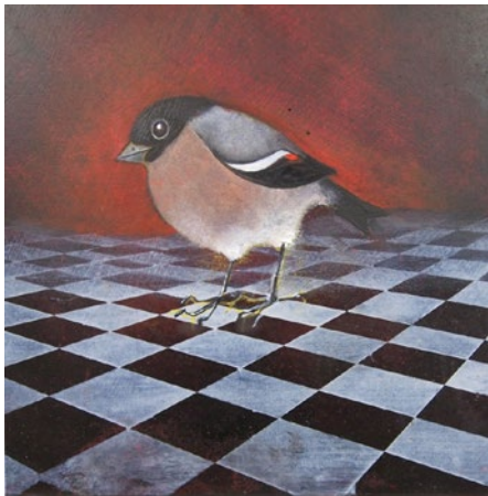
"Porträtt av herre", olja på duk, 20x20 cm

Bor och arbetar i Stockholm och på Österlen