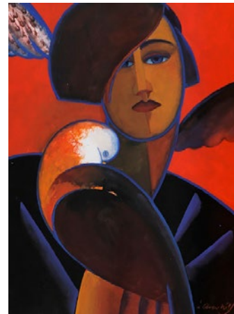
"Flickan och fågeln", giclée, 40x30 cm

Född 1920 i Malmö Bor och arbetar i Malmö