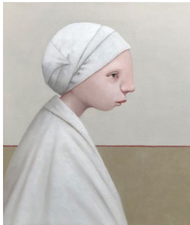
"Den betydelsefulle", olja på duk, 45x40 cm