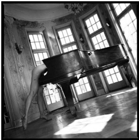
© Ewa-Mari Johansson, "To be or not to be", analogt fotografi på silvergelatinpapper

Född 1953 i Sölvesborg, Skåne Bor och arbetar i Stockholm och Milano