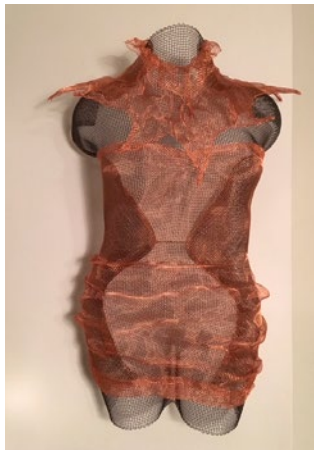
"Christy", järn och koppar, höjd ca 58 cm

Född 1956 i Stockholm Bor och arbetar på Österlen