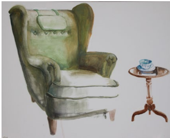
"Kom hem nu", akryl på duk, 53x66 cm

Född 1966 i Uppsala Bor och arbetar i Göteborg