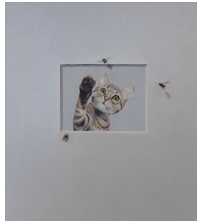
"No flying in front", mixed media, 55x40cm

Född 1977 i Malmö Bor och arbetar i Trelleborg