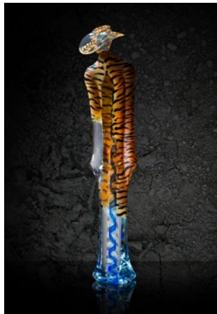
"TIGER MAN", glas, höjd ca 86 cm

Född 1946 i Stockholm Bor och arbetar på Öland