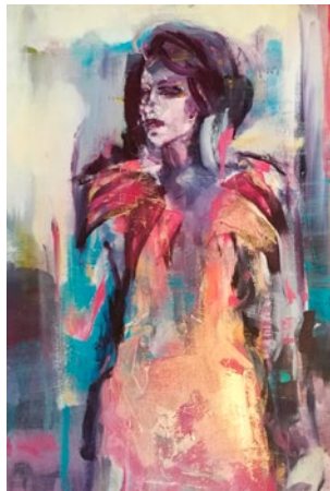
"Dignity", akryl på duk, 80x60 cm

Född 1978 i Södertälje Bor och arbetar i Stockholm