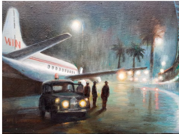
"Mottagningen". 30x40 cm olja på duk

Född 1956 i Stockholm Bor och arbetar i Stockholm