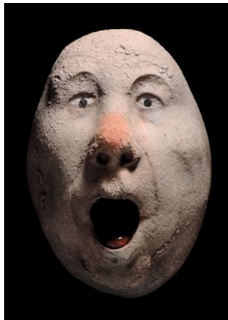
"Nylle", rakubränd keramik, höjd ca 15 cm

Född 1946 i Västerås Bor och arbetar i Smedstorp, Skåne