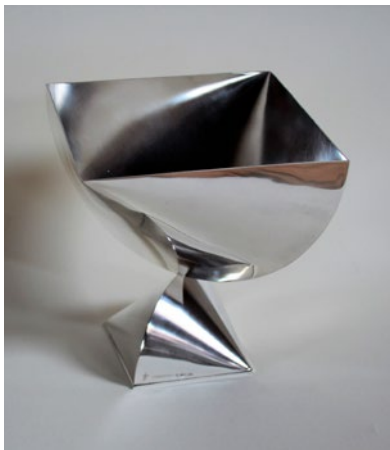
Skål i silver, höjd ca 16 cm

Född 1946 i Kristianstad Bor och arbetar i Kristianstad