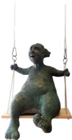
"I gungan", bränd lera, äggoljetempera och vax, höjd ca 50 cm

Född 1965 i Norge Bor och arbetar i Siljansnäs