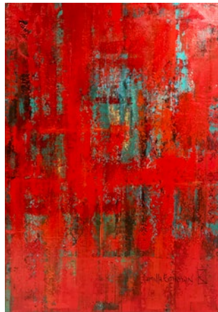
"Utan titel", akryl på linneduk, 120x85 cm

Född 1971 i Älmhult Bor och arbetar i Vellinge