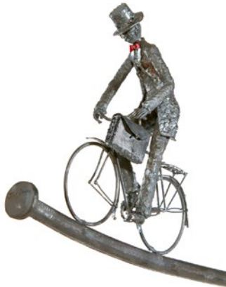
"Cyklande man", smält järn och järntråd, höjd ca 12 cm

Född 1946 i Rörum, Skåne Bor och arbetar i Kivik