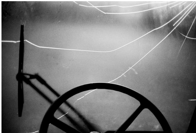
"Rur.Albo", analogt fotografi, Archival pigment print

Född 1977 i Sollentuna Bor och arbetar på Österlen