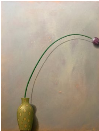
"Vila-eftertanke-besinning", olja på duk, 100x77 cm

Född 1950 i Malmö. Bor och arbetar i Malmö.