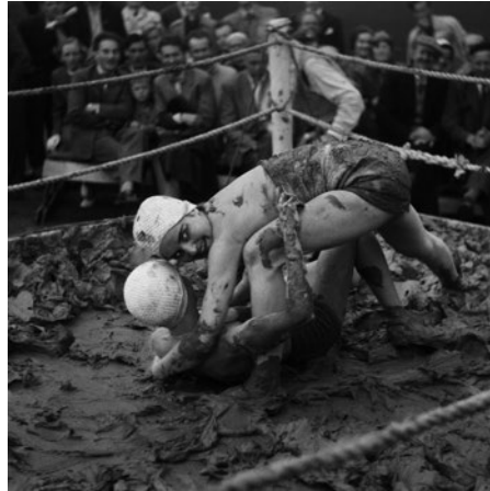
"Kiviks marknad 1953"

1922-2017 Född i Strängnäs och var bosatt i Stockholm