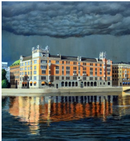
"Rosenbad", olja på duk, 86x80 cm

Född 1943 i Söderfors, Uppland Bor och arbetar i Södertälje